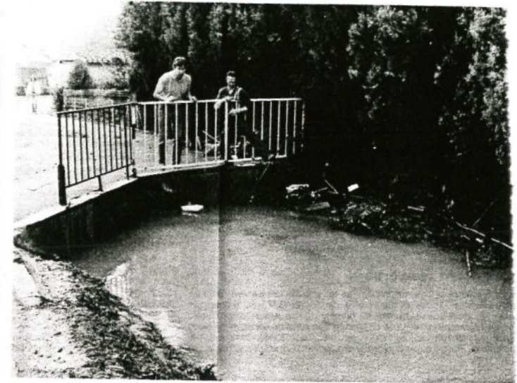
Le bief des Sept Fontaines : il n'a pu faire office de soupape