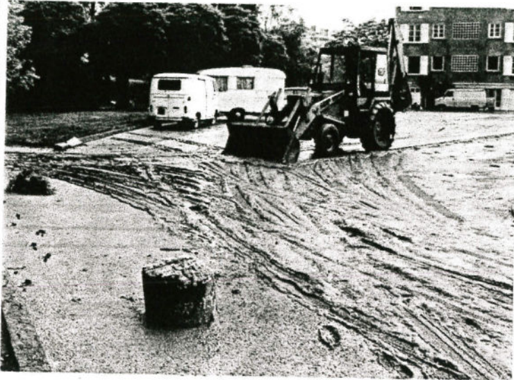
Le parking du Champ de Mars