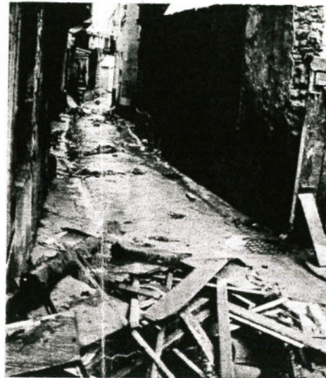
Le passage du bief des Sept Fontaines