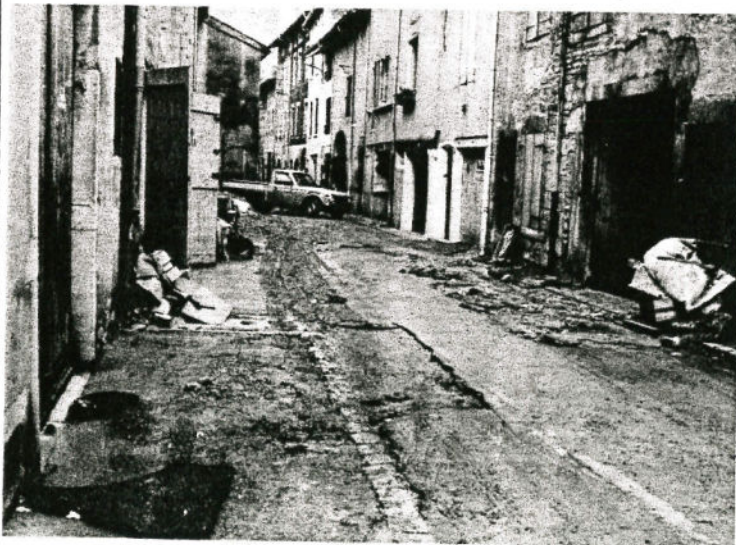
Beaucoup de dégâts rue Greuze